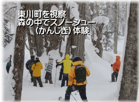
東川町を視察 森の中でスノーシュー (かんじき) 体験

莫大なお金をかけなくても「できる方法はある」 「真剣に取り組んでみる価値があるのでは」