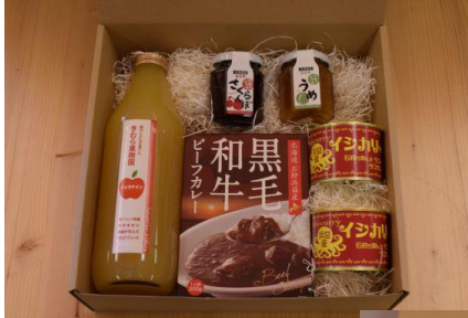
浜益ギフトセット