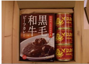
カレー食べ比べセット